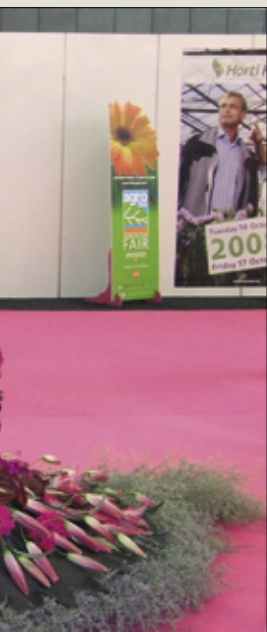
La coppia creata dal CIOPORA durante Horti Fair 2007 con il “pirata” rapitore della ragazza vestitadi fiori, simbolo delle varietà brevettate.

L'iter storico, che è approdato alla proposta della fusione, ha avuto inizio il 26 ottobre 2006 con la firma di una dichiarazione di intento. In seguito è proseguita con il “nulla osta” alla fusione concesso dall'Autorità Olandese per la Concorrenza nello scorso mese di Agosto. I prossimi mesi saranno utilizzati per rendere il più possibile operativa l'organizzazione congiunta della nuova gestione, che inizierà il 1° Gennaio 2008. Per il momento le principali cariche manageriali sono state già stabilite. ♣